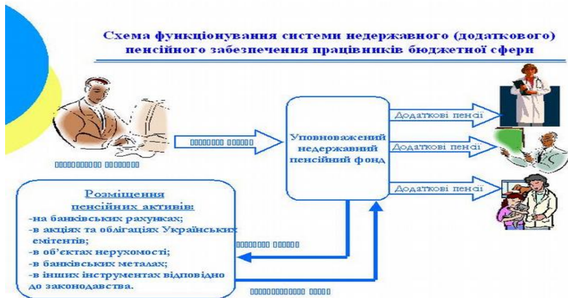
Схема функціонування системи недержавного (додаткового) пенсійного забезпечення працівників бюджетної сфери