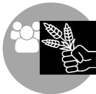
Програма 5. Формування на засадах інновацій експортно-орієнтованої харчової індустрії