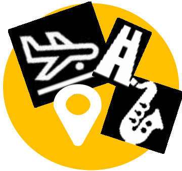
Програма 3. Інфраструктурний розвиток та глобалізація туристично-культурного середовища