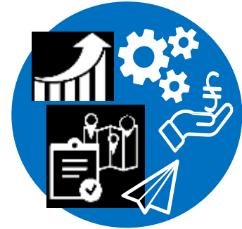
Програма 4. Ефективний економічний простір