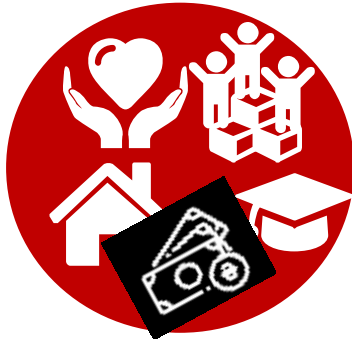
Програма 1. В центрі уваги - ЛЮДИНА

Програми регіонального розвитку спрямовані на реалізацію передбачених Стратегією оперативних цілей (напрямків) та завдань, конкретизовані в технічних завданнях на проекти регіонального розвитку, з визначенням орієнтовних обсягів і джерел фінансування.